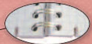
Doppelspiralen aus Stahl